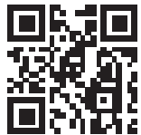
Ersatzhaltestelle Ri. Altomünster