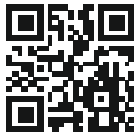
Ersatzhaltestelle Ri. Giesing